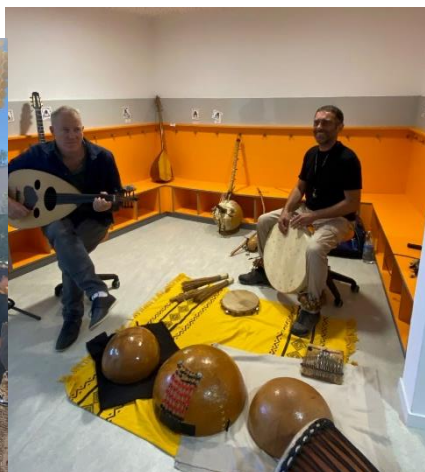
Le studio de musique